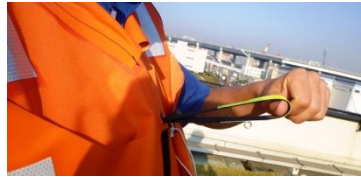
リフティングループ